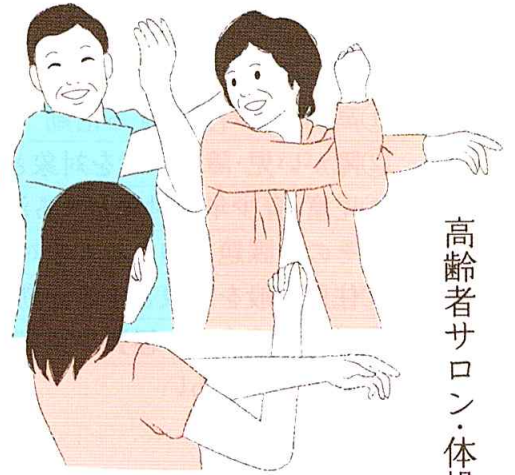
高齢者サロン・体操

赤い羽根共同募金は、あなたのまちの地域福祉を支える大切な財源です。 活動のための資金ニーズを取りまとめ、地域ごとに計画(使いみちの額)を定めて寄付を募るしくみです。