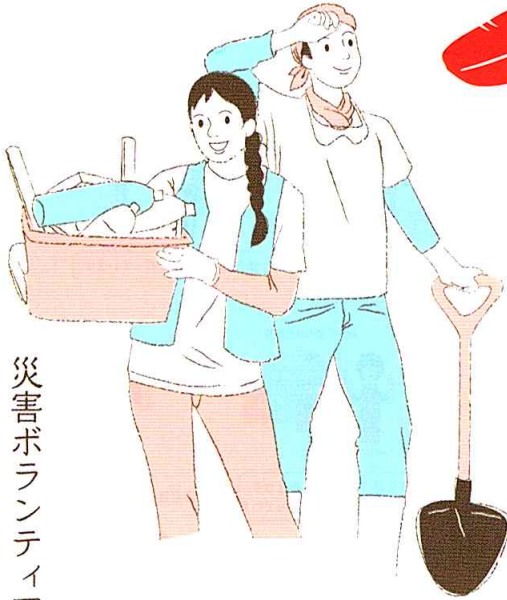
災害ボランティア支援