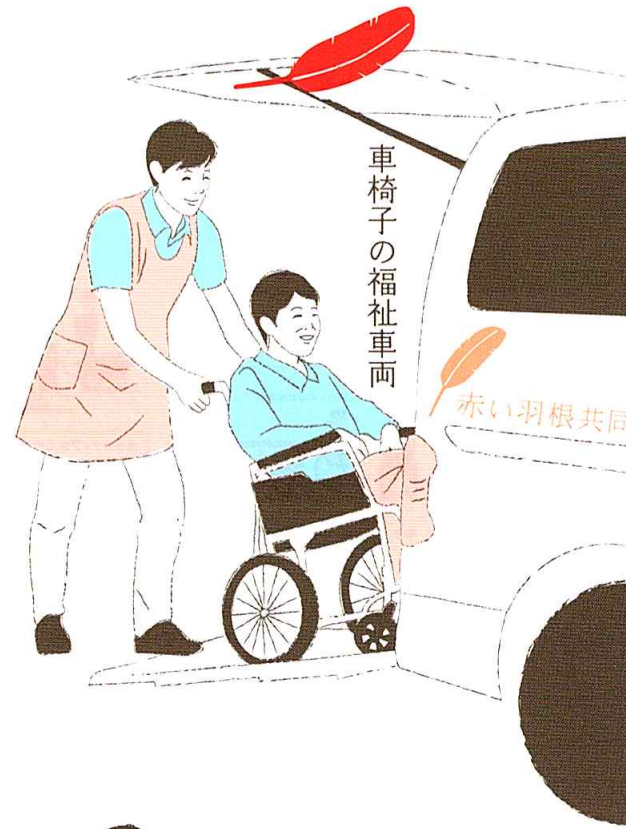
車椅子の福祉車両